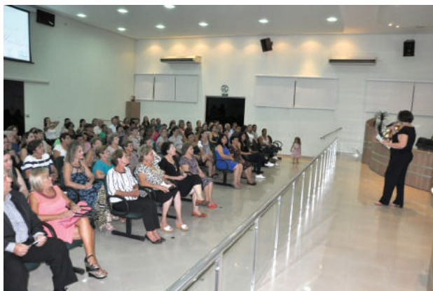
Evento realizado na Câmara Municipal em homenagem ao Dia Internacional da Mulher.

O Fundo Social de Solidariedade de Santo Antônio de Posse realizou na sexta-feira (10), na Câmara Municipal, um evento em homenagem às mulheres pelo Dia Internacional da Mulher comemorado no dia 8. Foram homenageadas dez mulheres que representaram com seus exemplos na sociedade às pessoas que desenvolvem suas funções com muito amor e dedicação.