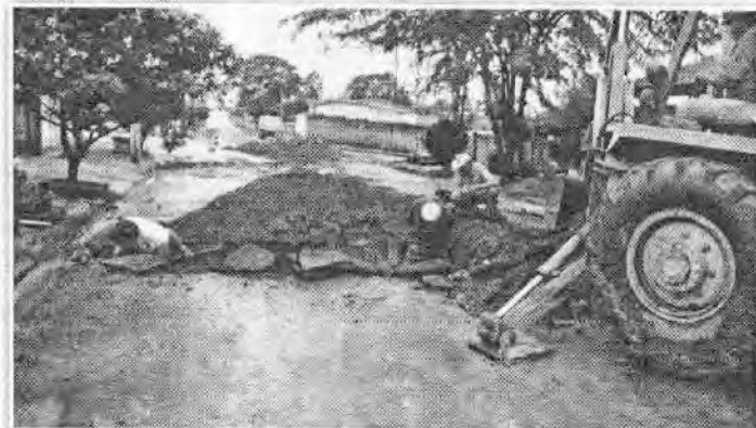
REDE DE ESGOTO: Estão em andamento as obras de construção de rede de esgoto nos bairros que interligam ao Centro da cidade.