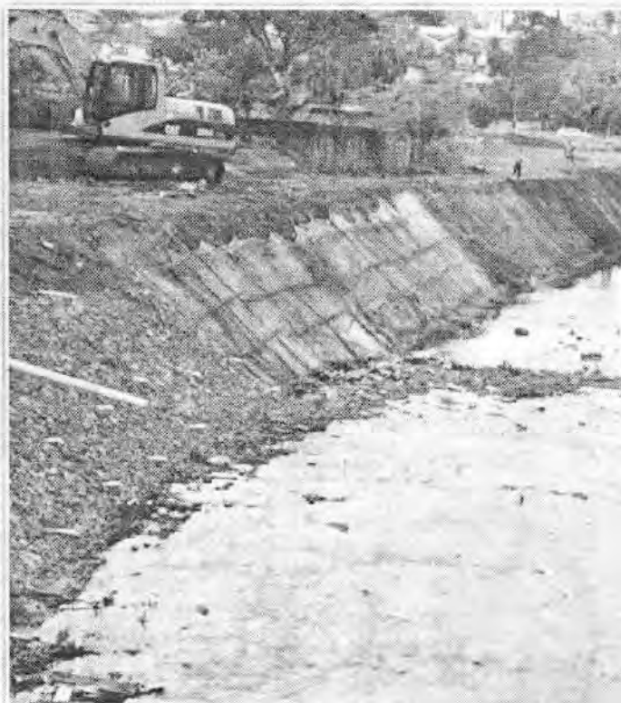
CÓRREGO: A construção de novas pontes e a canalização do córrego Monte Santo estão a todo vapor. Desassoreado e com a antiga ponte removida, agora o córrego recebe pedras, grades e concreto para sua canalização.