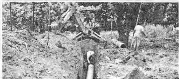
EMISSÁRIO: Estão sendo executadas as obras do emissário que interligará a rede de esgoto do município até à Estação de Tratamento de Esgoto.