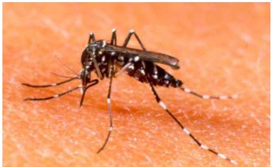
Mosquito transmissor da dengue: Aedes Aegypti