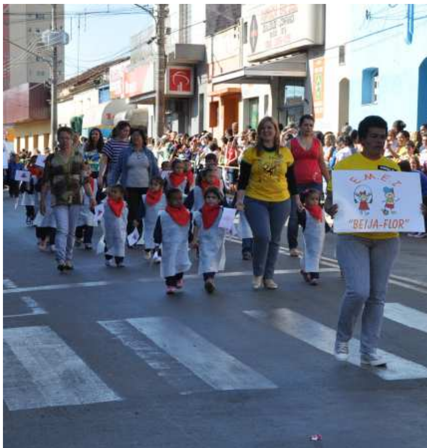
Durante o desfile em 2010

A VI Exposição de Orquídeas de Santo Antonio de Posse será realizada nos dias 25 e 26, na EMEF Mario Bianchi. No sábado, das 8h00 às 20h00 e no domingo das 8h00 às 17h00. A entrada é gratuita.