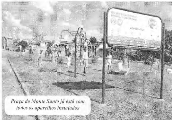
Praça do Monte Santo já está com todos os aparelhos instalados