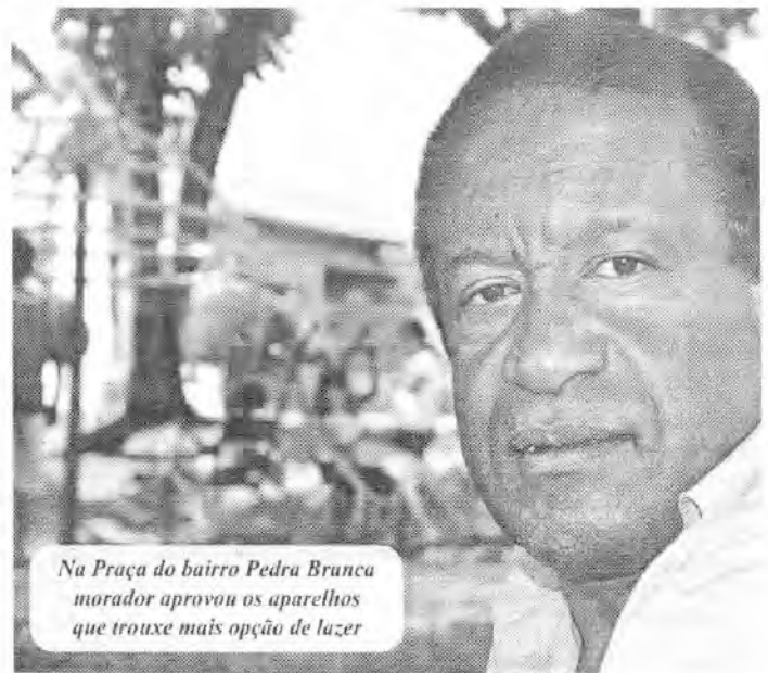
Na Praça do bairro Pedra Branca morador aprovou os aparelhos que trouxe mais opção de lazer