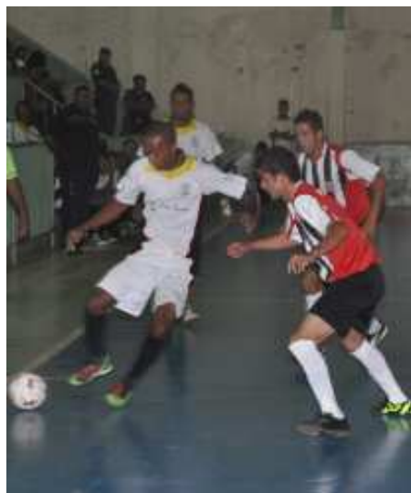
TABELA DE JOGOS

Começa nesta sexta-feira, dia 20, no Ginásio Municipal de Esportes Francisco Ferreira da Silva (Chicão) o XIV Campeonato Municipal de Futsal realizado pelo Departamento de Esporte e Lazer de Santo Antonio de Posse. O primeiro jogo está marcado para às 19h15 com duelo entre as equipes Clin Med e BenficaLoco. A seguir o duelo será entre as equipes Olímpia e Molekezica e para encerrar a noite a equipe Lyon enfrenta a E.E. Sto. Antonio “B”.