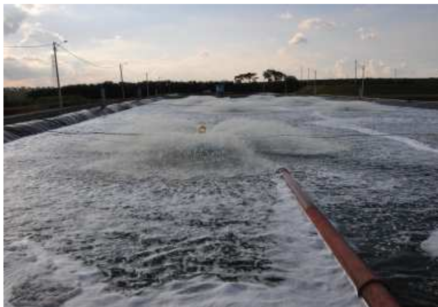
Lagoa de Tratamento da ETE

Na última sexta-feira, dia 13, o Governador do Estado de São Paulo, Geraldo Alckmin, inaugurou a ETE - Estação de Tratamento de Esgoto Antonio Martins de Souza – Nico d'Água e também liberou recursos para conclusão de 100% da rede coletora de esgoto na área urbana e infraestrutura completa no bairro Bela Vista.