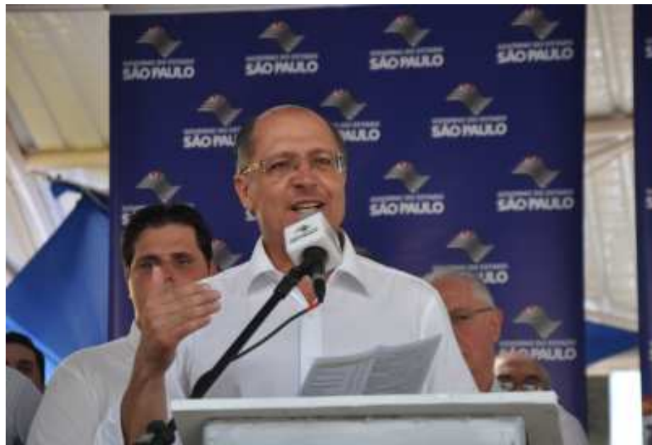
“Tratar o esgoto é cuidar da saúde”