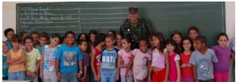
Palestras nas escolas

nas em problemas de violência. Mas isso não é verdade. Estiveram em nosso município e nos ajudaram a fazer plantio de árvores, ministraram palestras sobre saúde bucal e atuaram efetivamente na campanha de combate a dengue”, explicou o Prefeito de Santo Antonio de Posse. Os militares também realizaram simulações com forças oponentes, um grupo de outro pelotão tentava passar por ‘bandidos’ com roupas e carros utilizadas por pessoas comuns e os soldados precisavam descobrir quais eram essas pessoas que tentavam passar por eles. “Tenho apenas que agradecer essa maravilhosa cidade que tão bem nos acolheu. Além de toda operação intitulada como Operação Jaguari e que abrangeu 19 cidades do estado de São Paulo, fiquei muito impressionado de como a população nos recebeu. Tive a oportunidade de acompanhar algumas palestras sobre saúde bucal