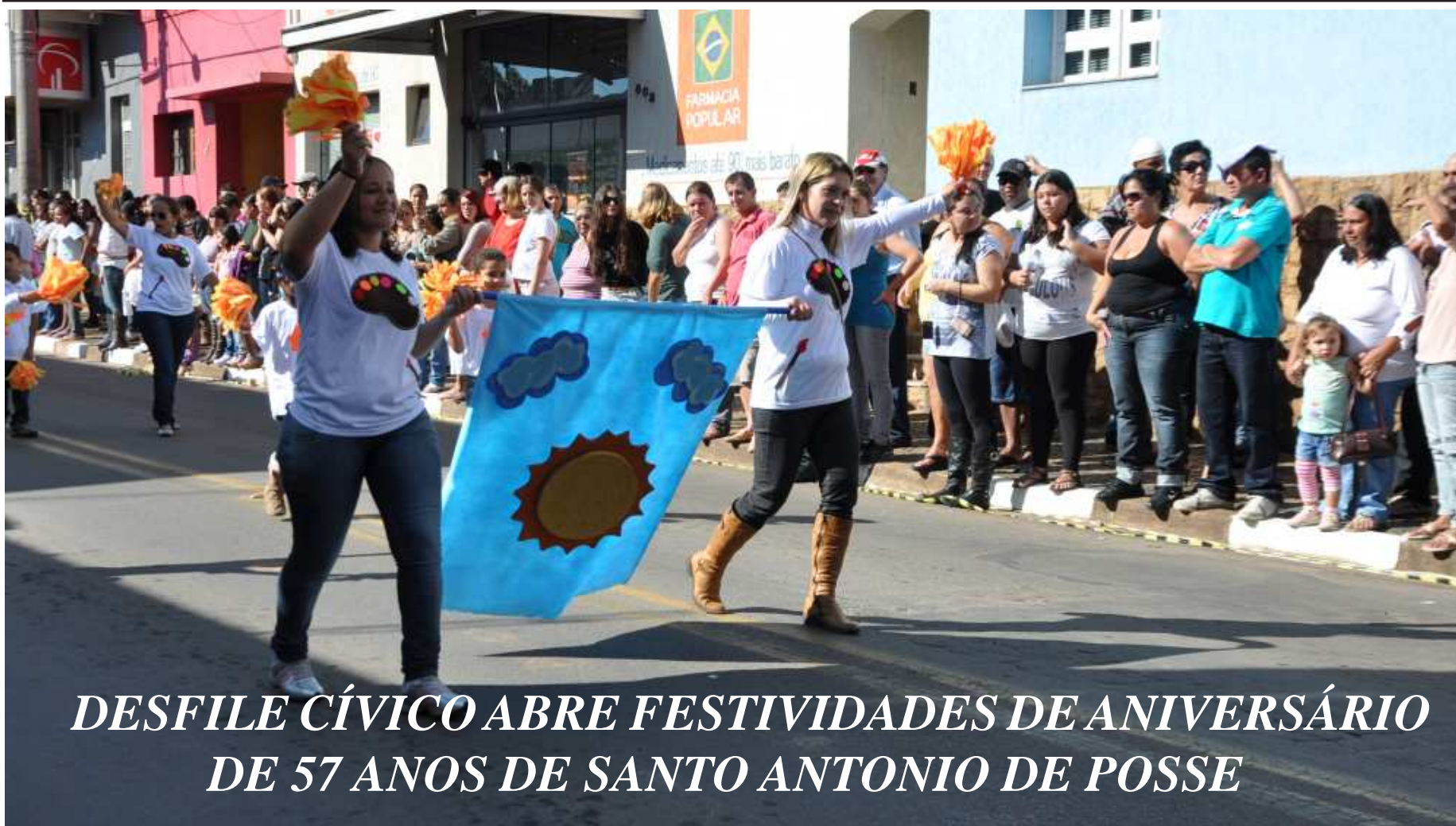
DESFILE CÍVICO ABRE FESTIVIDADES DE ANIVERSÁRIO DE 57 ANOS DE SANTO ANTONIO DE POSSE

Órgão Oficial do Município de Santo Antônio de Posse DISTRIBUIÇÃO GRATUITA -Ano III - número 120 - 8 de junho de 2012