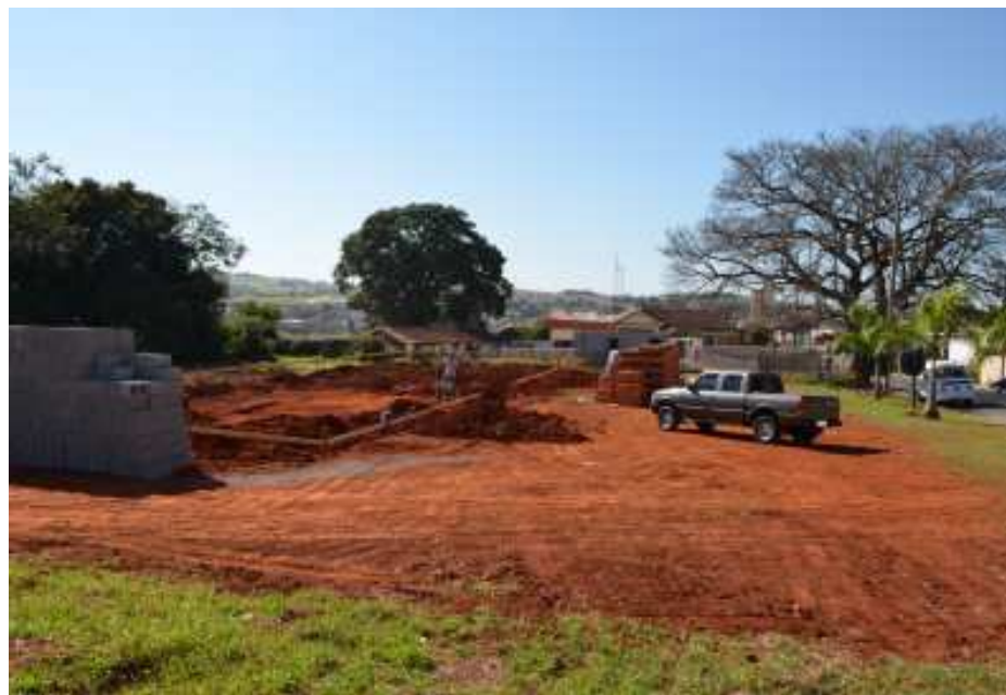
Previsão de término é de quatro meses

Teve início na semana passada as obras para construção do Terminal Rodoviário, ao lado da Paineira, à Rua Dr. Jorge Tibiriçá. O prazo previsto para término é de quatro meses. O terminal terá 580 m 2 de construção e investimento de 706.000,00 (setecentos e seis mil reais), através da Secretaria de Logística e Transportes do Estado de São Paulo.