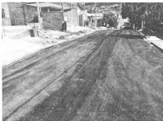
Rua Arlindo Aparecido Masotte