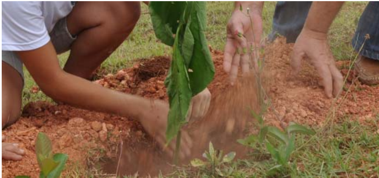
Projeto Arboriza Posse 2010 plantou mais de 2.800 mudas de árvores