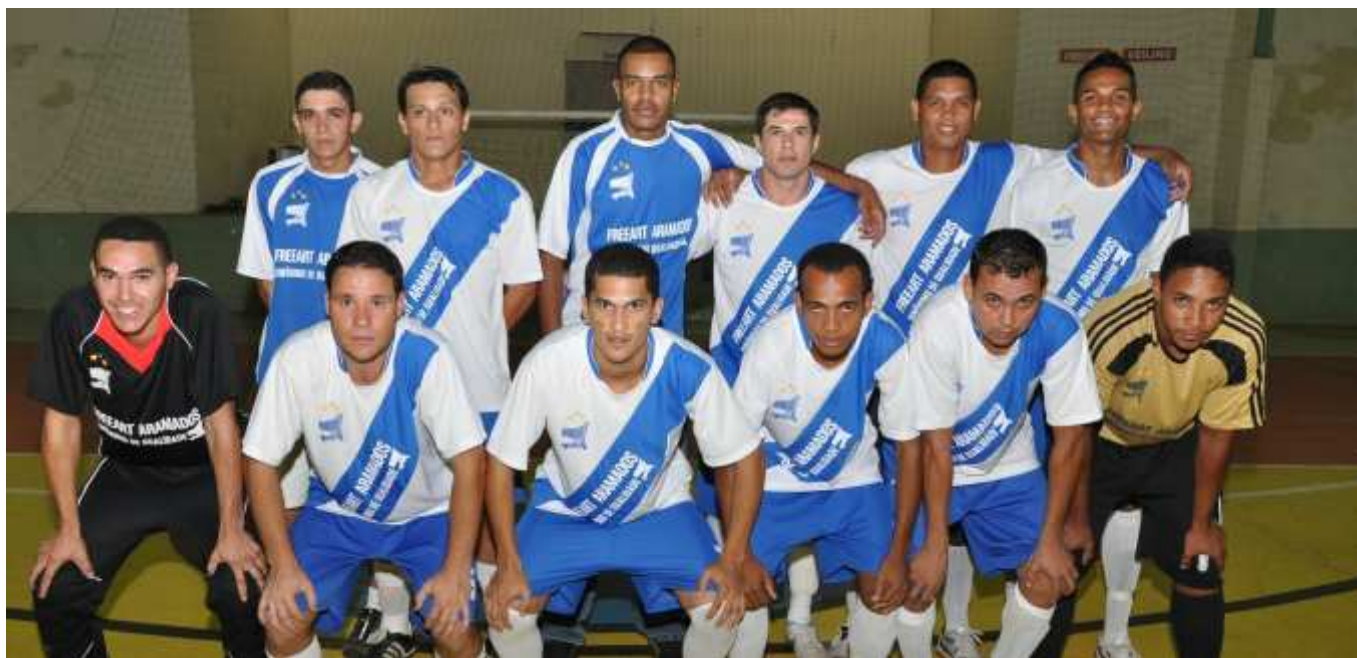
Equipe Campeã Freart