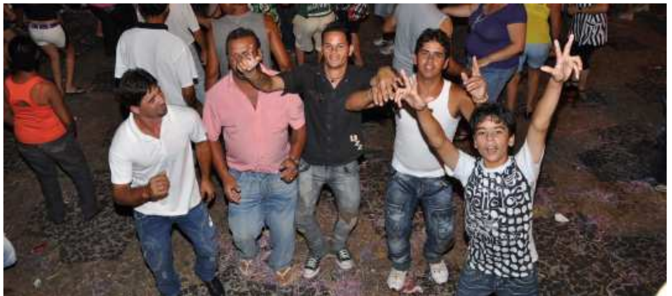
Durante a festa em 2010