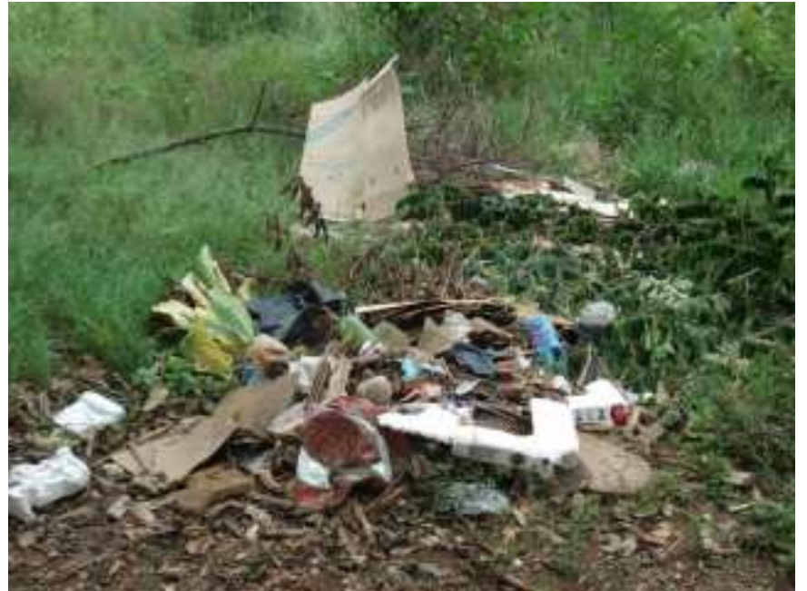
Entulhos de objetos que acumulam água são principais criadouros