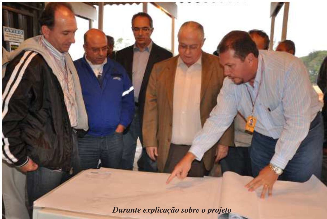
Durante explicação sobre o projeto