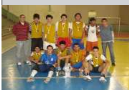
Mala Velha - Campeã