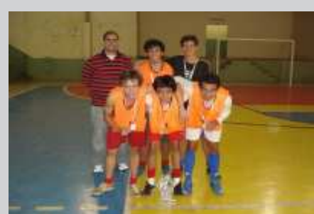
Terra Morta - Vice - Campeã