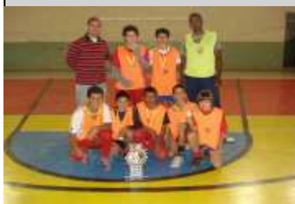
Real Madri - Campeã