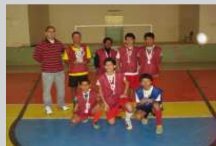
Paulista - Vice - Campeã