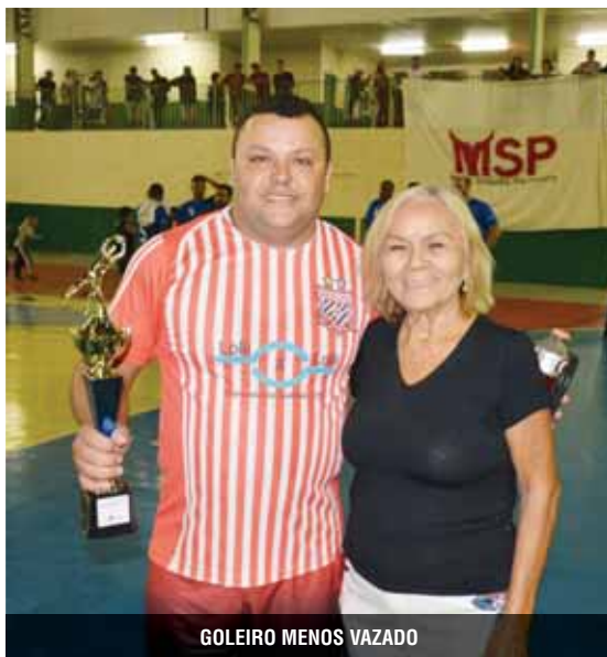
GOLEIRO MENOS VAZADO