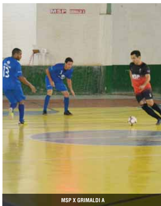
MSP X GRIMALDI A