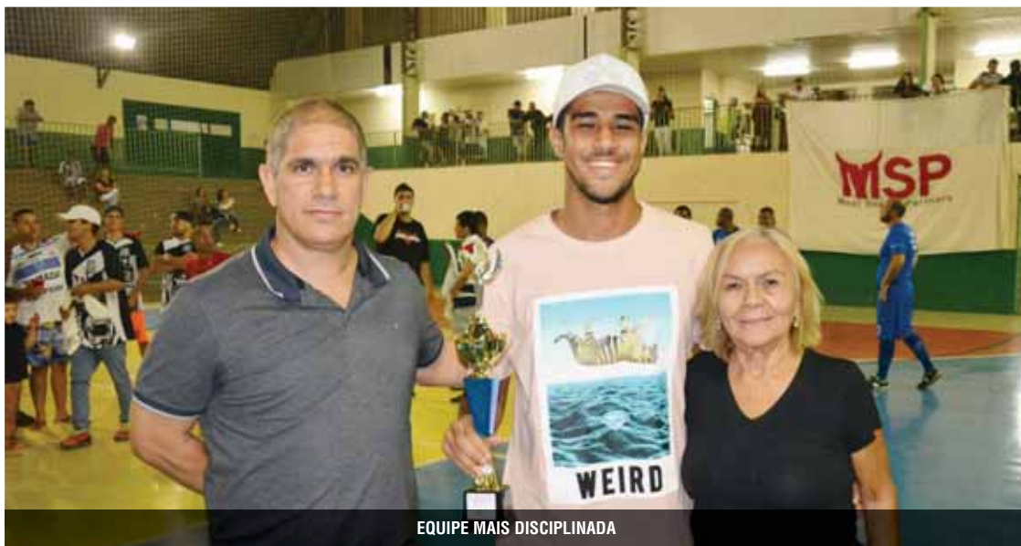
EQUIPE MAIS DISCIPLINADA