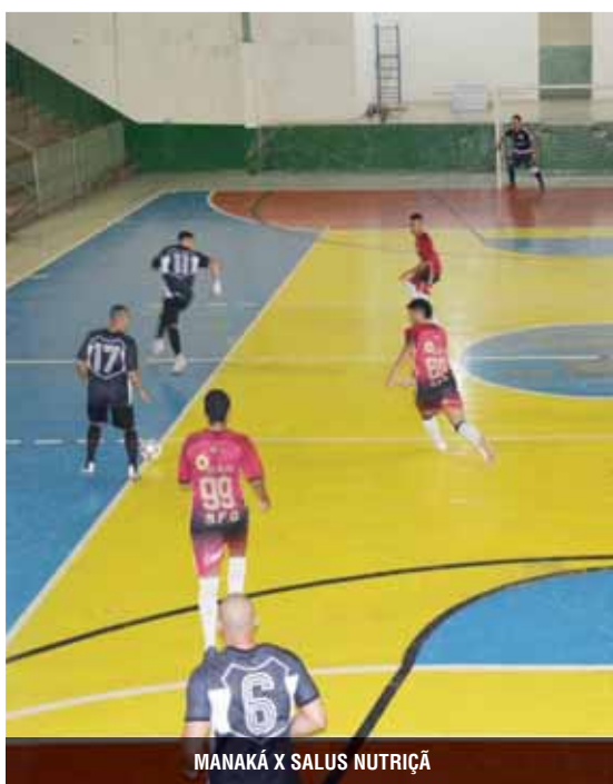
MANAKÁ X SALUS NUTRIÇÃ