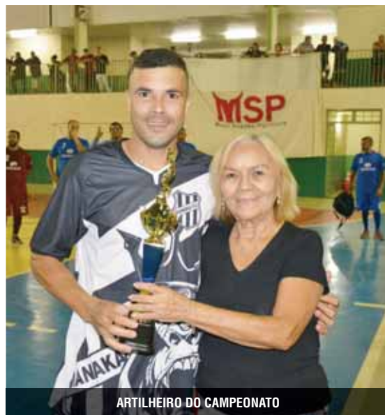
ARTILHEIRO DO CAMPEONATO