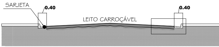
CORTE TRANSVERSAL DA RUA