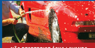
NÃO DESPERDICE ÁGUA LAVANDO CARROS, CALÇADAS E QUINTAIS