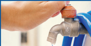
FECHE BEM A TORNEIRA