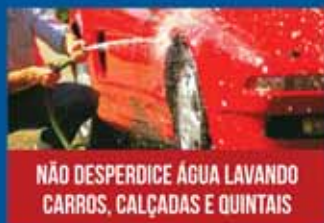
NÃO DESPERDICE ÁGUA LAVANDO CARROS, CALÇADAS E QUINTAIS