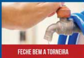
FECHE BEM A TORNEIRA