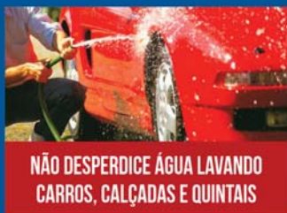
NÃO DESPERDICE ÁGUA LAVANDO CARROS, CALÇADAS E QUINTAIS