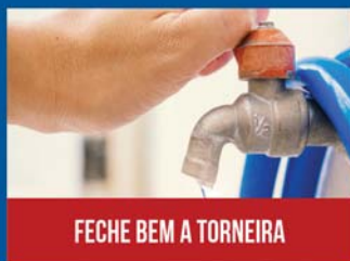
FECHE BEM A TORNEIRA