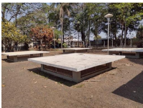
ITEM 02 - Reservatório enterrado Saudade 1000m 3 Rua Assumpta Bazani Fiorini, 60