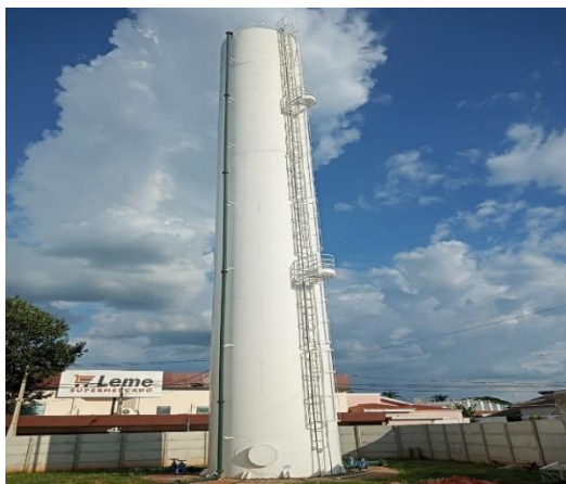
ITEM 13 - Reservatório Vila Rica 300 m 3 Rua Assumpta Bazani Fiorini, 60