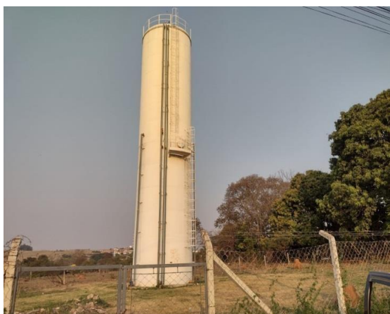
ITEM14- Reservatório Padre Pedro Tomazzini 350m 3 Rua Benjamin Solera, 191