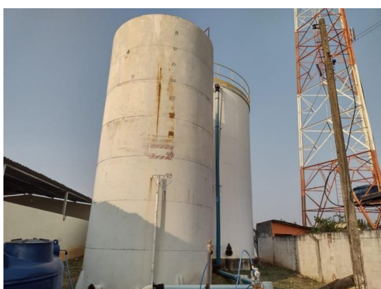
ITEM 15-Reservatório S. Judas Tadeu 500m 3 Rua Marcelina Bocaletto Lolli, 173