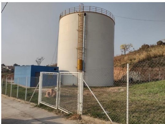
ITEM 07-Reservatório Bela Vista 1200m 3 Rua Fares Baracat, s/n