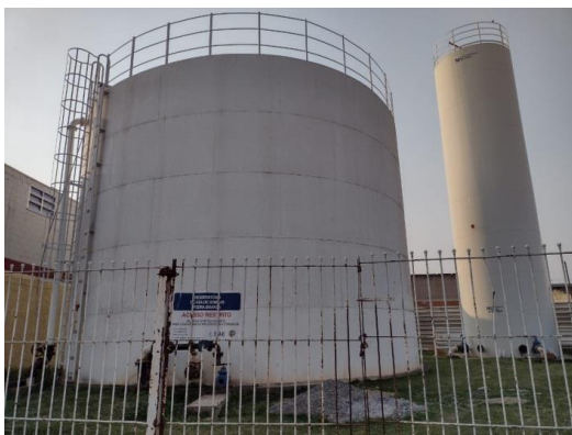
ITEM 16/ITEM 3 -Reservatório Pedra Branca I 620m 3 e II 110 m 3 Rua Sigilfredo Grimaldi,79