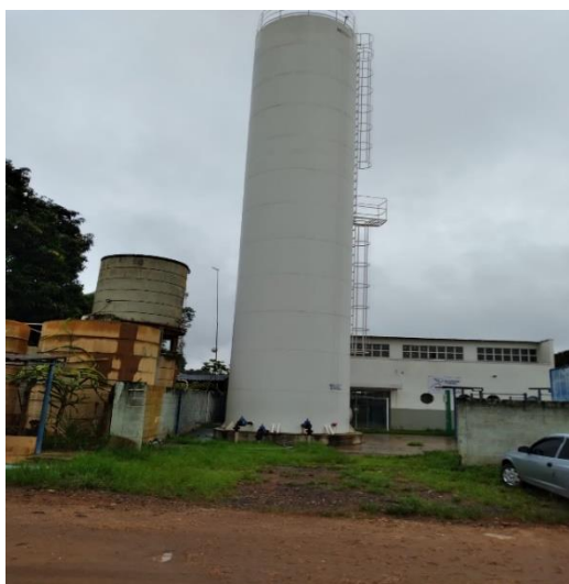
ITEM 10- Reservatório Recreio Campestre 200 m 3 Rua Sebastião Rissati, 89