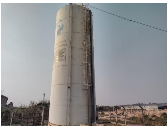
ITEM 08-Reservatório Bela Vista 120m 3 Rua Carlos Alberto da Fonseca, 275