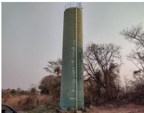
ITEM 01- Reservatório Cidade Jardim 200m 3 Rua Oriovaldo Porfirio, s/n