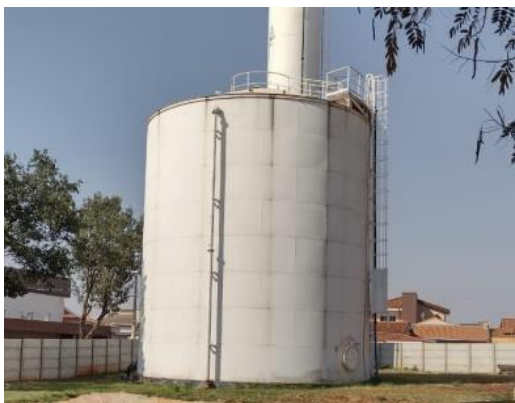
ITEM 06- Reservatório elevado Saudade 1200m 3 Rua Assumpta Bazani Fiorini, 60