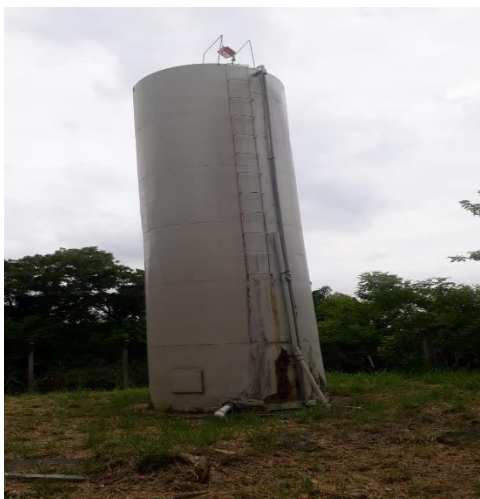
ITEM 04- Reservatório do Vale verde 120 m 3 Rua Santa Rita, s/n