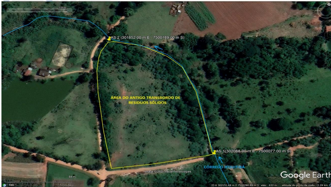
Fig.1. Rua João Dalmolin, 954, B. Benfica, S. Antonio de Posse.